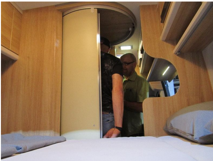
Genaue Insprektion aller „Räume“