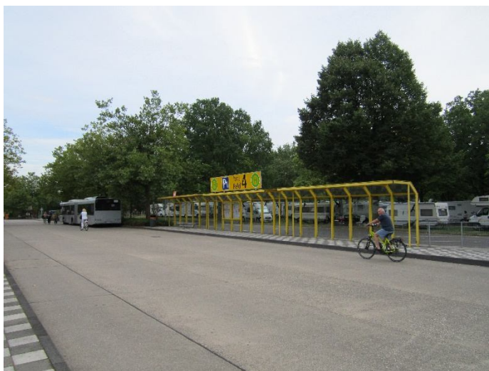
Haltestelle Shuttlebusse zu den Eingängen und täglicher Shuttle in die Altstadt 18:30 – 0:00 Uhr