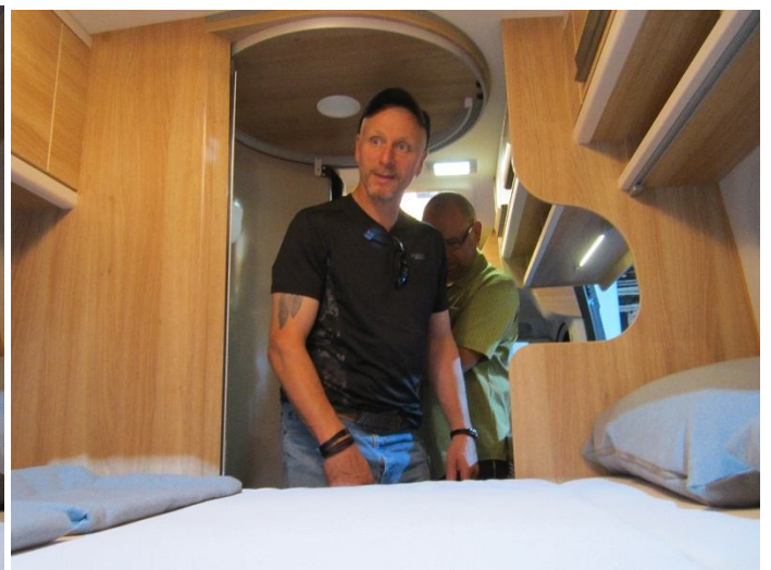
Na das hat ja was