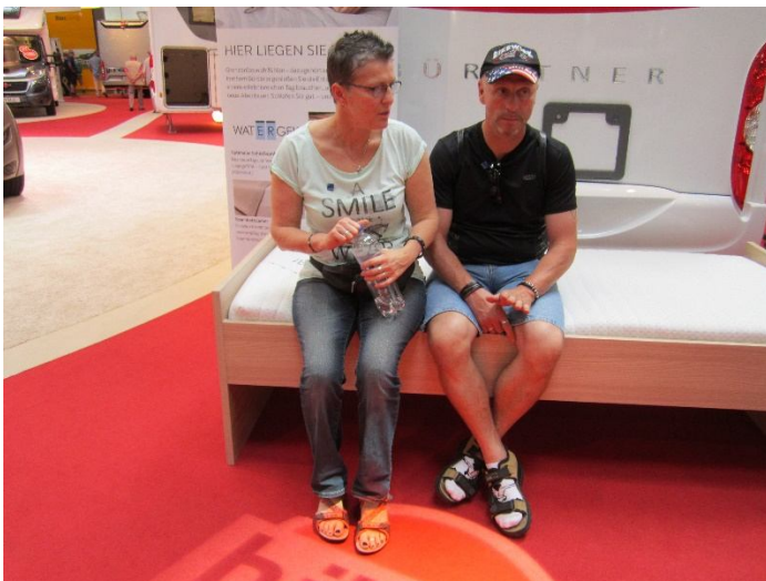
Zu viel - Jetzt erst mal überlegen – welcher denn nun .....