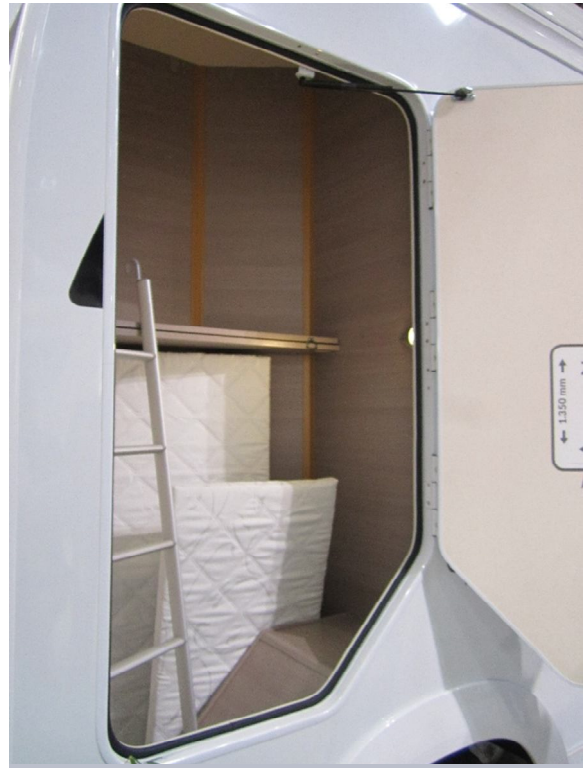
aber eine Heckgarage ist das gerade mal nicht wirklich