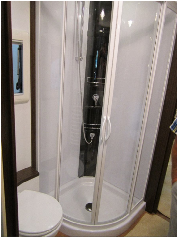
Dusche ist schon gut