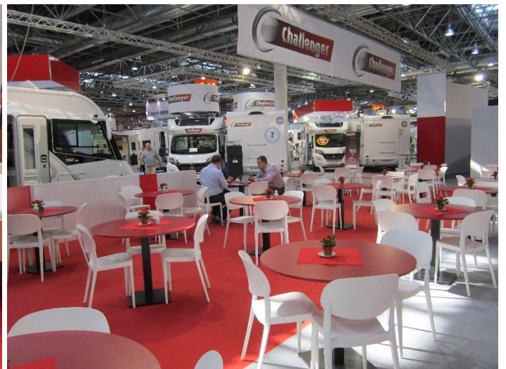
und doch zur Verkaufsberatung..... oder doch nicht?